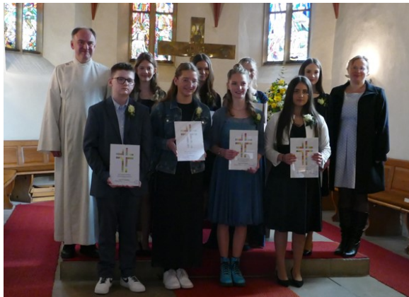
Vor dem Altar der Göbricher Kirche