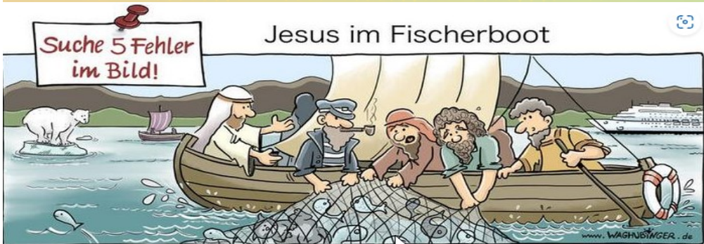
Eisbär, Katze, Kapitän, Kreuzfahrtschiff, Rettungsring