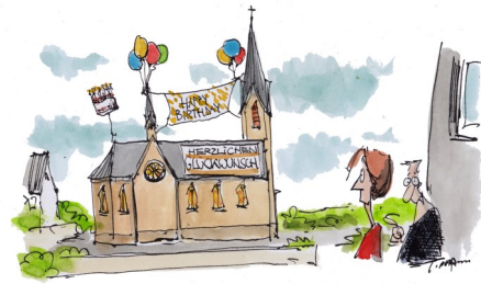
PFARRER KLEINSCHWITZ' FROHE PFLINGSTEN

Pfingsten wird somit als Fest des Heiligen Geistes begangen. Die Jünger sahen sich nach dem Tod Jesu