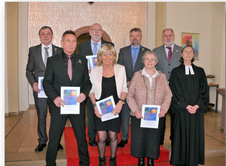
Goldkonfirmation (50 Jahre)