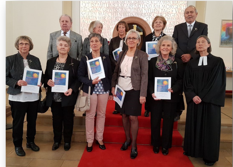
Diamantkonfirmation (60 Jahre)

täten im Land. Die Regierung will dadurch angeblich „die Religionsfreiheit der Bürger schützen“. Einige chinesische Kirchenleiter sehen in der Verordnung jedoch einen unzulässigen Eingriff in genau diese Freiheit, denn sie macht detaillierte Auflagen für die Registrierung religiöser Organisationen und die Nutzung von Gebäuden für religiöse Aktivitäten. Lokale Religionsbehörden sind befugt, nach eigenem Ermessen über entsprechende Anträge zu entscheiden. Religiöse Lehrer oder Mitarbeiter religiöser Institutionen werden zur Auskunft gegenüber diesen Behörden verpflichtet. Die Verordnung umfasst auch religiöse Aktivitäten im Internet. Laut Artikel 47 unterliegt jegliches Engagement im Bereich religiöser Online-Informationen der Untersuchungs- und Genehmigungspflicht durch die Behörden.