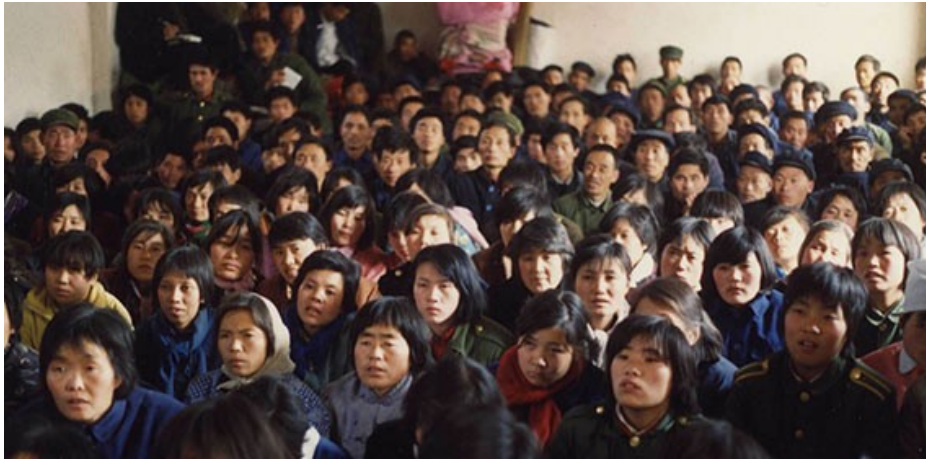
Mao konnte die Kirche nicht auslöschen – Untergrundkirche in China

Was Gott seit vielen Jahren in China tut, ist geeignet, unsere Zuversicht und unseren Glauben zu stärken. Mao Tse Tung hatte die chinesischen Kirchen in den 1960er und 1970er Jahren schwer unterdrücken und verfolgen lassen. Zahllose Christen wurden ins Gefängnis oder Straflager gebracht, viele getötet. Doch das Evangelium breitete sich im Untergrund aus und die Kirche in China ist heute wieder stark und sichtbar – zu stark in den Augen der Kommunistischen Partei unter Staatschef Xi Jinping.