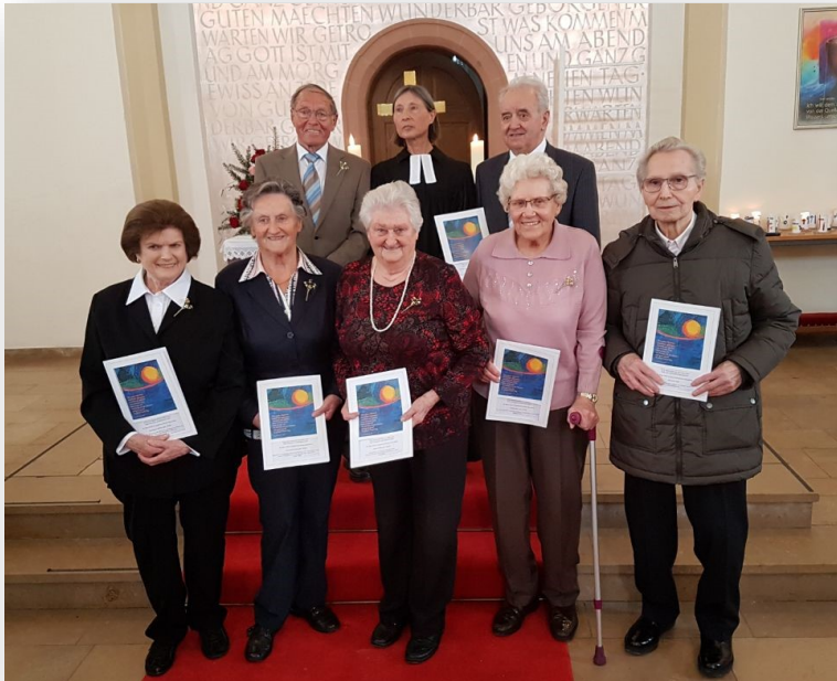
Gnadenkonfirmation (70 Jahre)