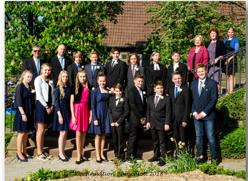
Konfirmation Bauschlott 2018

Konfirmiert werden kann, wer bis zum 30. Juni 2019 das 14. Lebensjahr vollendet hat. Zur Anmeldung sollte mindestens ein Elternteil mitkommen. Bitte bringen Sie das Stammbuch der Familie mit.