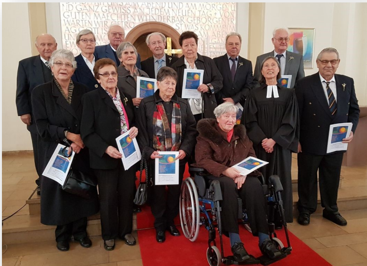
Eiserne Konfirmation (65 Jahre)