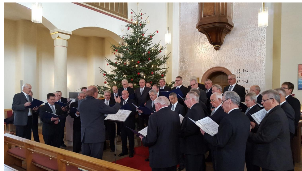
Den Weihnachtsgottesdienst bereichert traditionell der Sängerbund Bauschlott. Dafür allen Sängern und ihrem Dirigenten ein herzliches Dankeschön!

Am 13. März 2016 feiern wir in einem Festgottesdienst mit Abendmahl in unserer Kirche Jubelkonfirmation.